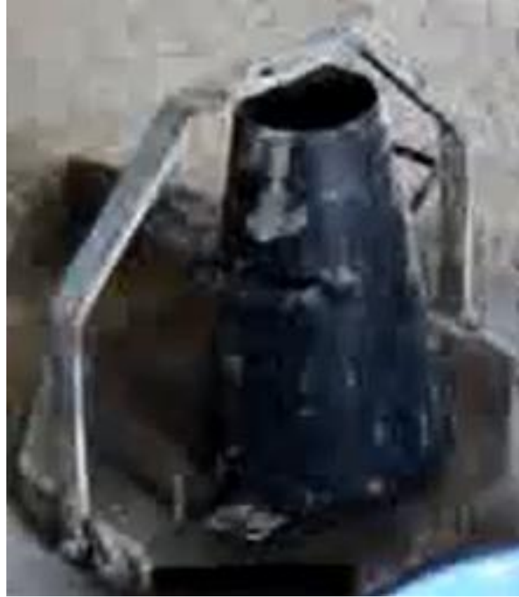
স্ল্যাম টেস্ট এর কোণ