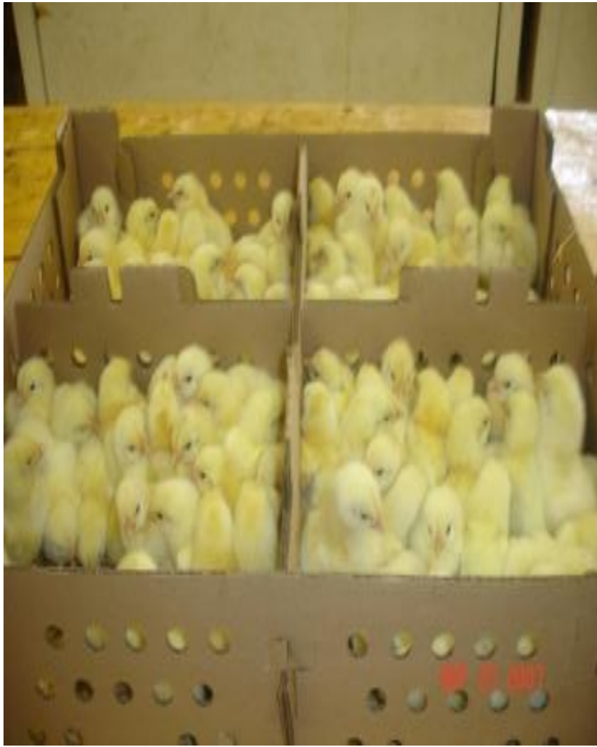
একদিনের ব্রয়লার বাচ্চা