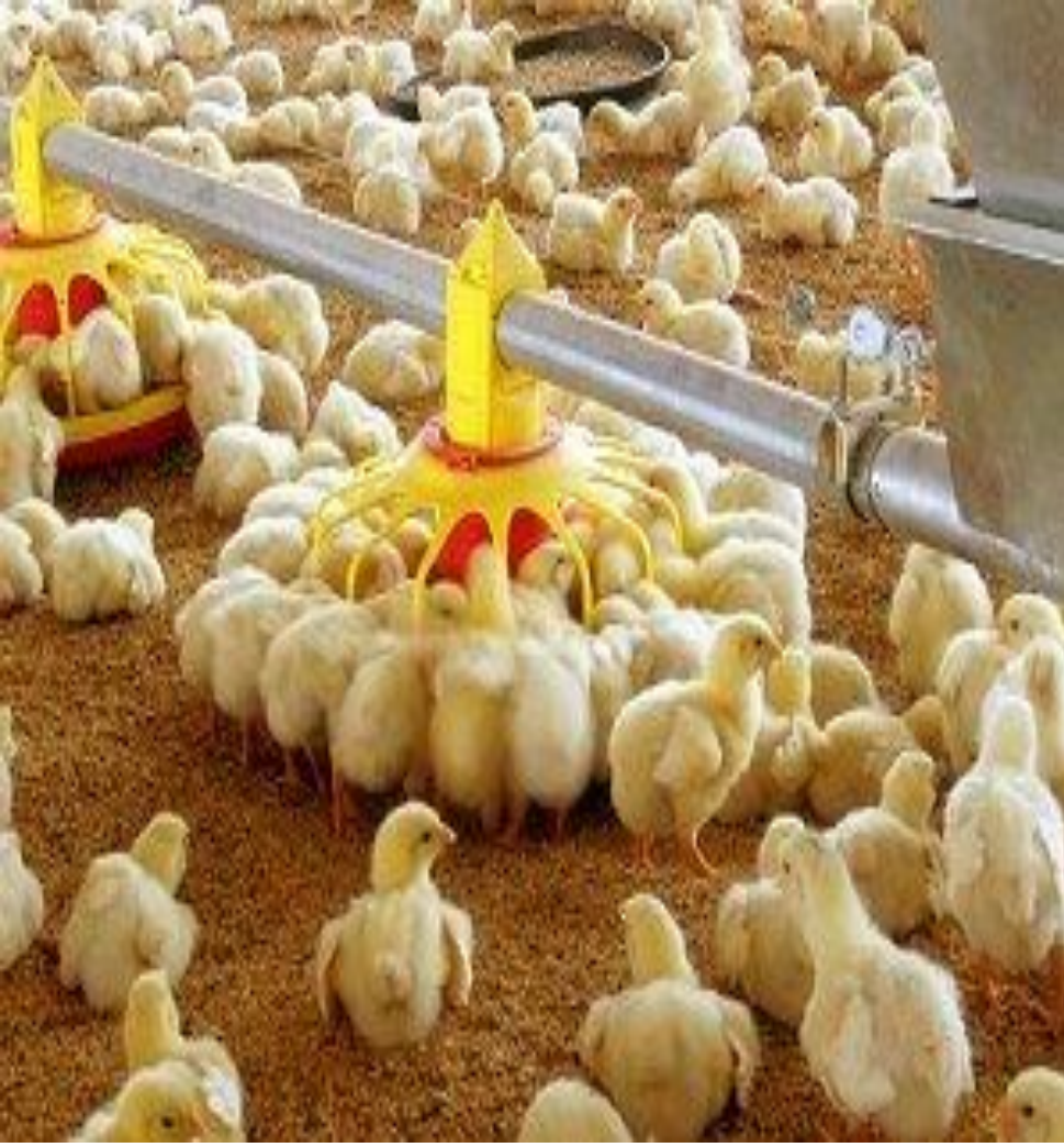
ব্রয়লার বাচ্চার খাদ্য ও পানি গ্রহন