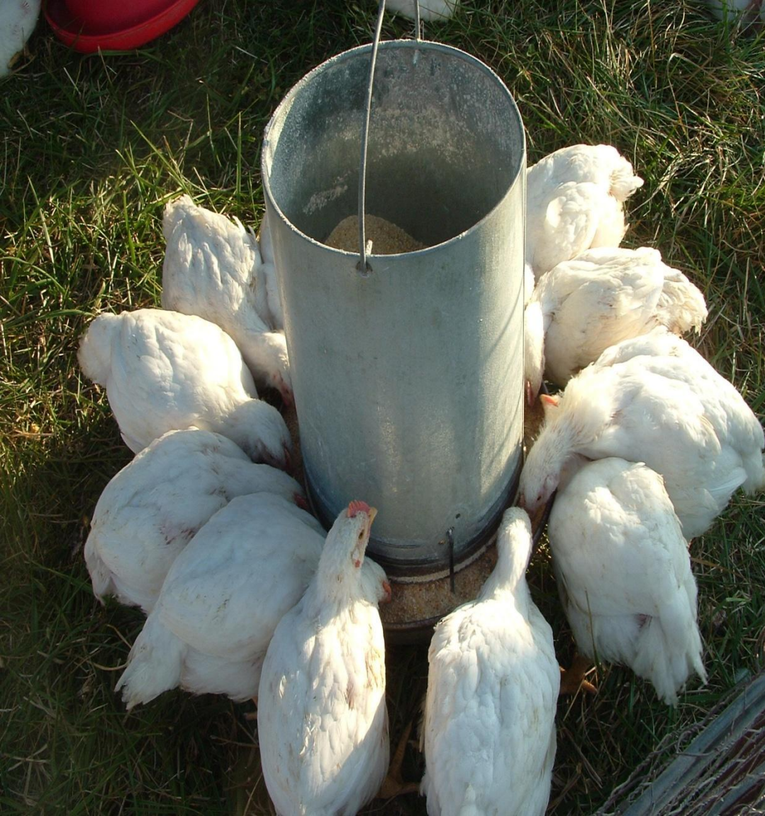
৬ সপ্তাহ বয়সের ব্রয়লার