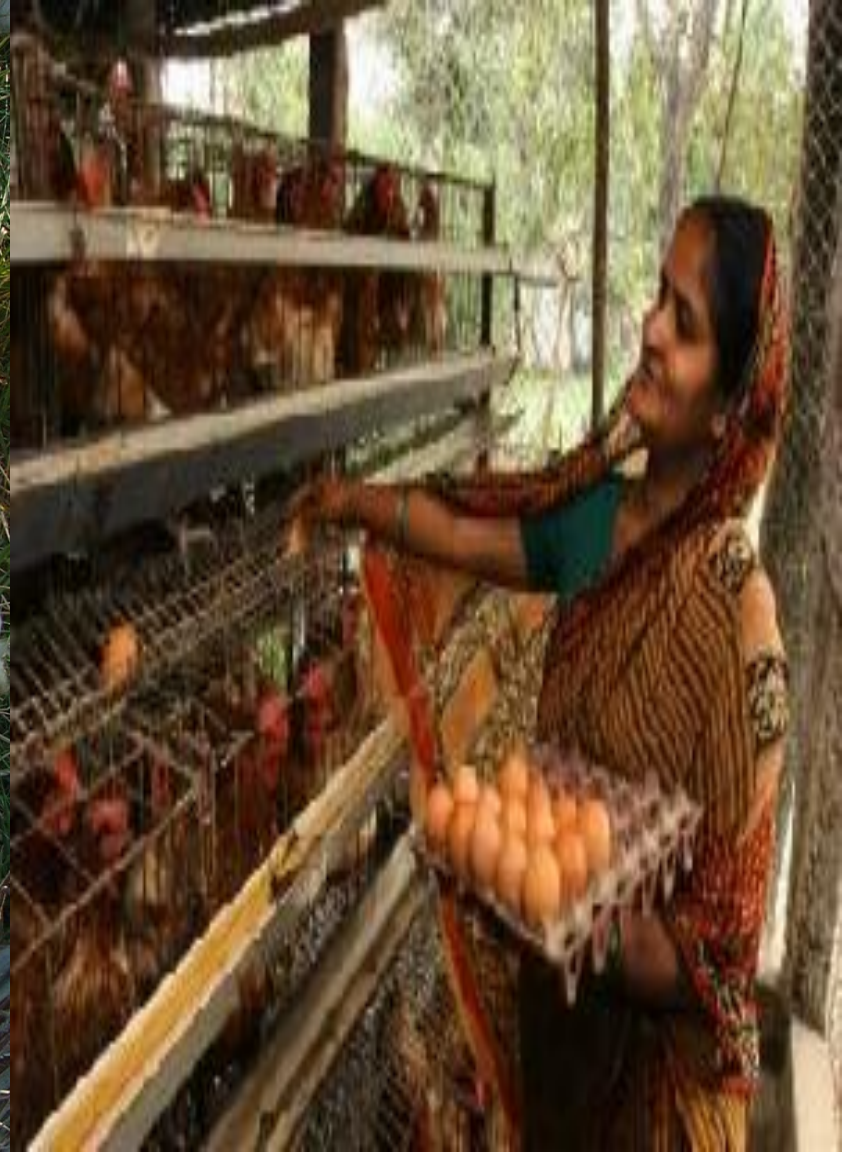
ডিম পাড়া লেয়ার মুরগী